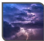
Tormenta 110 dB