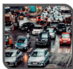
Tráfico 100 dB