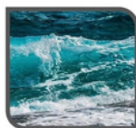
Olas de mar 85 dB