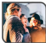
Conversación 65 dB