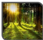
Bosque 60 dB