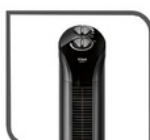
Eole Infinite 48dB